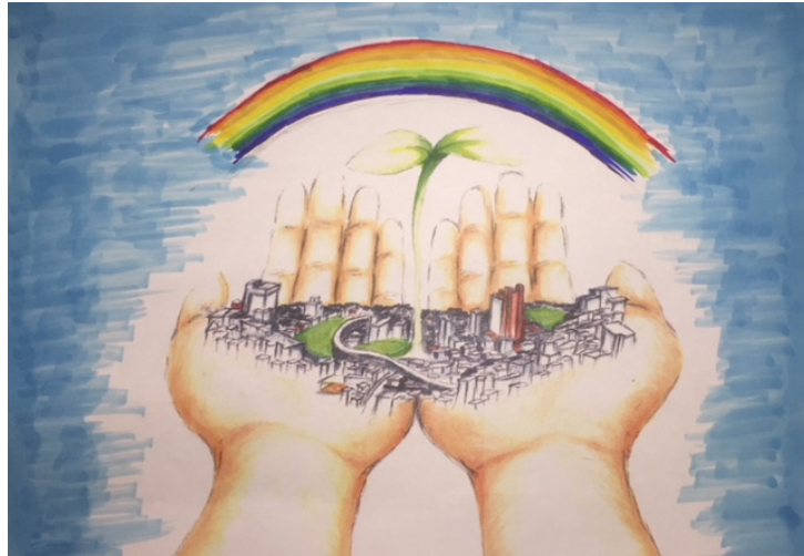
縦4m×横6mの巨大なモザイクアートになります。